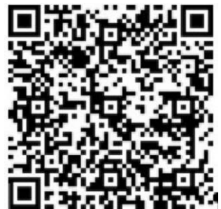
QR-Code für Banking-Apps

In diesem Jahr wird für ein Projekt des Herz-Jesu-Klosters in Neustadt/W. gesammelt: In einer Pfarrei im Tschad sollen u.a. Brunnen gebaut werden, um den Zugang zu Trinkwasser zu erleichtern. Ein Brunnen kostet 2.500 €. Das Hungermarsch-Team hat sich für diesen Hungermarsch das ehrgeizige Ziel gesetzt, zehn Brunnen zu finanzieren. Es braucht dafür also 25.000 €. Bei der diesjährigen Christbaumsammelaktion kamen bereits Spenden in Höhe von 5.973 € zusammen.